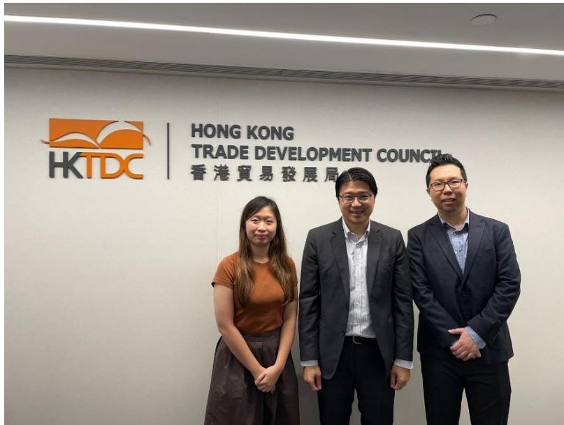
圖二：香港恒生大學及香港運輸物流學會物流政策委員會代表在香港貿發局分享 ESG 調查中段結果